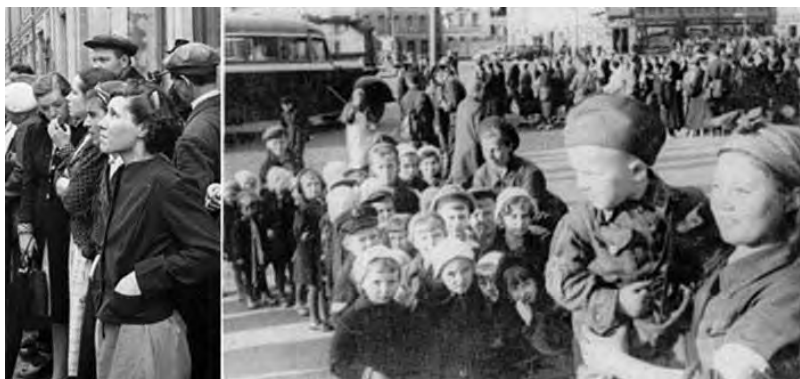
Отправка ленинградских детей в тыл

Пришел с фронта отец, начал работать на прежнем месте, он токарь. Выделили нам подвал, окна на уровне земли. Видишь только ноги идущих. Жили довольно бедно, отец долгое время ходил в солдатской шинели. В 1952 году дали нам одну комнату на пятерых. Но мы сумели стать полноценными людьми общества.