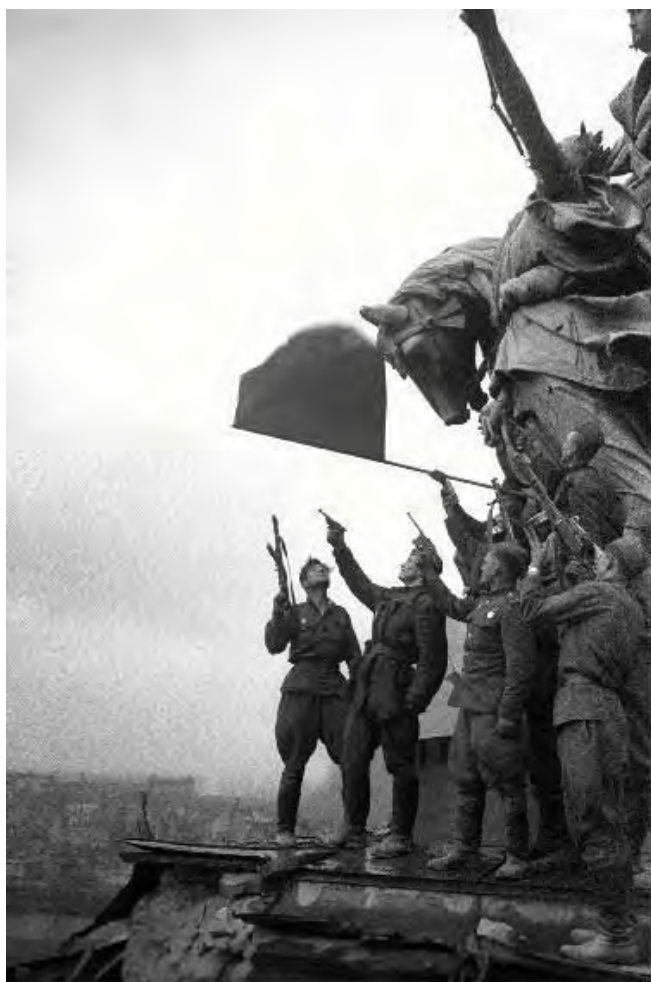
Берлин, Рейхстаг. Салют в день Победы 9 мая 1945 года.