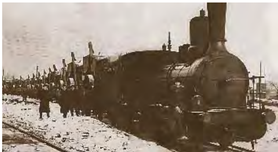
Отправка комбайнов из Украины на Урал. 1941 год.